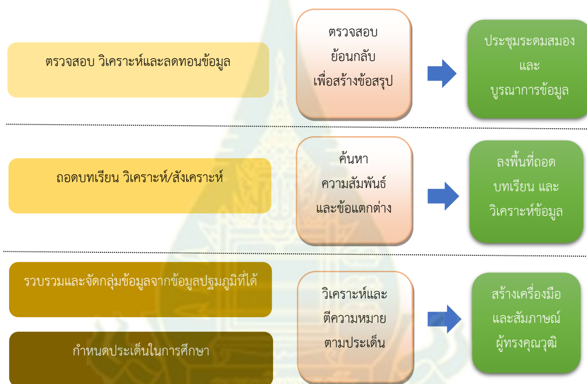
ภาพที่ 3.1 กระบวนการวิเคราะห์แบบขั้นบันได (The Ladder of Analytical Abstraction)

โครงการวิจัยเรื่อง “แนวทางการพัฒนารูปแบบการอาบป่าในบริบทการท่องเที่ยวในประเทศไทย” ครั้งนี้ เป็นการวิจัยเชิงปฏิบัติการแบบมีส่วนร่วม คณะผู้วิจัยออกแบบวิธีดำเนินการวิจัยเป็น 3 ขั้นตอน โดยประยุกต์กระบวนการวิเคราะห์แบบขั้นบันไดของคาร์เนย์ (Carney, 1990) มาใช้เป็นแนวทางในการออกแบบการวิจัยและวิเคราะห์ข้อมูล ดังภาพที่ 3.1